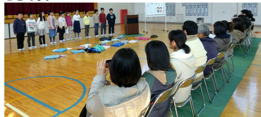
学習参観「二分の一成人式」(昨年度)

人間は社会の中で生活しているので決して一人では生きていくことができません。人との関わりの中で生きていくのですから、人のために自分ができることや、挑戦したいことを広げていく学びや努力、自分が周りの人のために何が出来るかという積極的な視点をもつことなどはとても大切なことです。