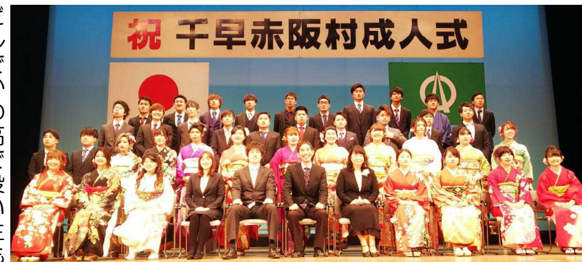
今年の千早赤阪村成人式 恩師と記念撮影

家になりたい、などの夢や希望は、決して個人の自己満足ではなく、そこに向かって努力し、社会のために自分の力を高めたい、社会の中で自分はこのような役割を果たしたいという自己実現という生きがいにつながるのです。